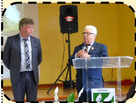
Michel Lefait, Député.

Faisons de l'année 2016 une année de combats pour plus d'égalité, de solidarité, de fraternité et de justice sociale ! Bonne année à tous ! Vive Lespesses, vive la République et Vive la France !